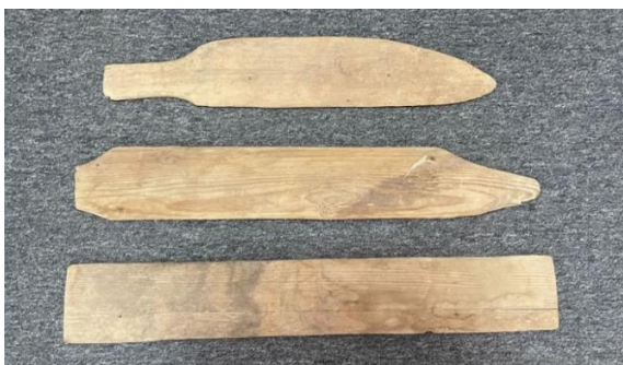
Сурет 3. Л.Р. Жанғұтованың «Сарайшық» мемлекеттік тарихи-мәдени музей-қорық қорығына тапсырған әжесінің «өрмек ағаш» құралы.

«Өрмек ағашы» құралын атамыз, Өтеәліұлы Шаймардан әжеміз, Әсіма Есжанқызына арнап жасап берген екен. 1990-жылдарға дейін әжеміз, Әсіма Есжанқызы өзінің өрмек ағашымен «қақпа алаша» тоқып жүрді. Әжеміз, Әсіма Есжанқызы дүниеден озған соң, қазақ халқының қолөнерін нақыштайтын «өрмек ағашын» «Сарайшық» мемлекеттік тарихи-мәдени музей-қорық қорығына тапсыруды жөн көрдім».