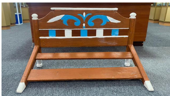
Сурет 1. «Сарайшық» мемлекеттік тарихи-мәдени музей-қорық қорығындағы «Жастық ағаш».