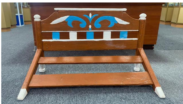
Сурет 1. «Сарайшық» мемлекеттік тарихи-мәдени музей-қорық қорығындағы «Жастық ағаш».