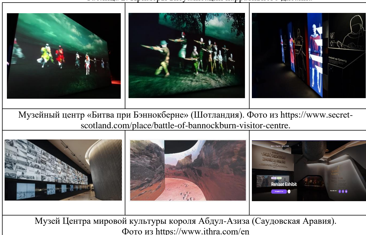
Таблица 2. Примеры визуализации нарративного дизайна

Фонд музея насчитывает более 10 000 оригинальных экспонатов, начиная от экспонатов Модэ-шаньюя, основателя первого кочевого государства и, заканчивая артефактами, связанными с деятельностью правителей и знати монгольских государств до начала XX века. В залах обозначенного музея с целью усиления впечатления текстовый и визуальный нарративы гармонично сочетаются. Не меньшее внимание привлекает и экспозиция, представленная в музее «Статуя Чингизхана».