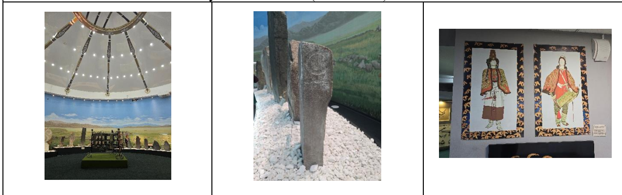
Национальный музей имени Алдан-Маадыр Республика Тыва (Россия).

Необходимо отметить, что, для современной Монголии фигура Чингисхана – один из аспектов дискурса национальной идентичности, что проявляется на всех уровнях общественной жизни. Об этом А.С. Шмыт пишет «...традиционная культура уходит из повседневности, преобразаясь в фантом, с помощью которого строится воображаемое сообщество – нация. В центре этого фантома находится фигура Чингисхана – источника власти, закона, государственного суверенитета и жизненной силы монгольского народа» [Шмыт, 2014: 309].