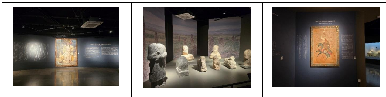
Музей Чингизхана (Монголия).