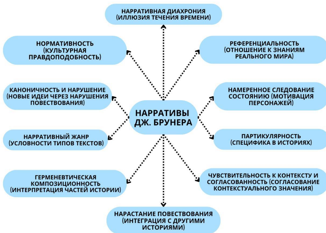
Схема 1. Нарративы по Дж. Брунеру

При разработке нарративного дизайна, разумеется, главной должна выступать «функция объединения духовного опыта, исторического наследия, поиска идентичности, восстановления роли и функции подлинных традиционных национальных ценностей» [Кудайбергенов, Темиртон, Карабаева, Исмагамбетова, 2023: 93].