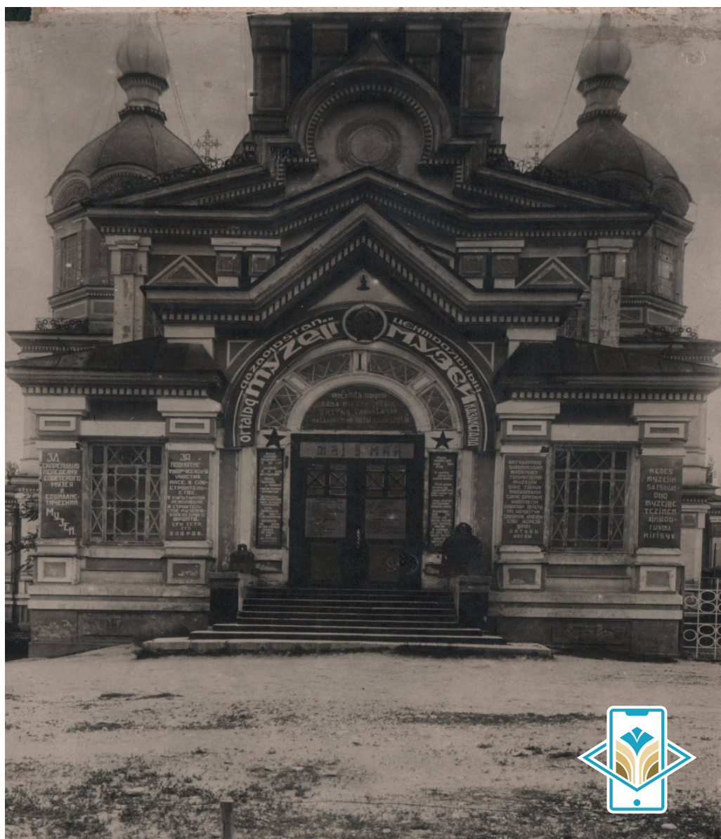
Сурет 4. Вознесенский кафедралды соборының ғимараты. XX ғ. ҚР МОМ қорынан.

комиссариаты туралы Ереже Халық Комиссарлары Кеңесіне 1921 жылы 27 маусымда ұсынылғаны мен қабылданғанын атап өту керек [ҚР ОМА, 93: 39 арт. п.]. Сондықтан, Қырғыз (қазақ) халық ағарту комиссариатына қарасты басқа мекемелердің «Ережелері» осыдан кейін дайындалып, бекітілді деп жорамалдауға болады. Осыдан 1922 жылдың 24 қаңтарында қабылданған «Орталық өлке музейі туралы ереже» дәл осы жылы музейге «Орталық музей» мәртебесі берілді дегеннің нақты дәлелі бола алмайды. 1920 жылдардың басында Халық Комиссарлары Кеңесі осы кезеңдегі Қазақстанның саяси жүйесінде қалыптасқан жалпы жағдайды қорытындылай келе, өлкеде жүргізіліп жатқан ағартушылық жұмыстарға қысқаша сипаттама берген. Онда «Бүкіл Ресей Федерациясындағыдай Қазақ КСР-дің халықтық ағарту істері жұмысшылардың материалдық қажеттіліктері мен сұраныстарын қанағаттандыру мағынасында соңғы орында болды. Бұл халықтық ағарту істерінің материалдық базасына нұқсан келтірді. Қырғыз халық ағарту комиссариатының идеологиялық және әкімшілік басшылығына және жалпы халықтық ағарту істеріне теріс әсер етті», – деп айтылған. Сонымен қатар Ресей Федерациясы аумағында, атап айтқанда Қазақстанда, мәдени-ағарту жұмыстарын дұрыс жолға қоюға Жаңа экономикалық саясатты жүргізу үшін халық шаруашылығын қайта құрумен байланысты үрдістер кедергі келтірді [ҚР ОМА, 89: 109].