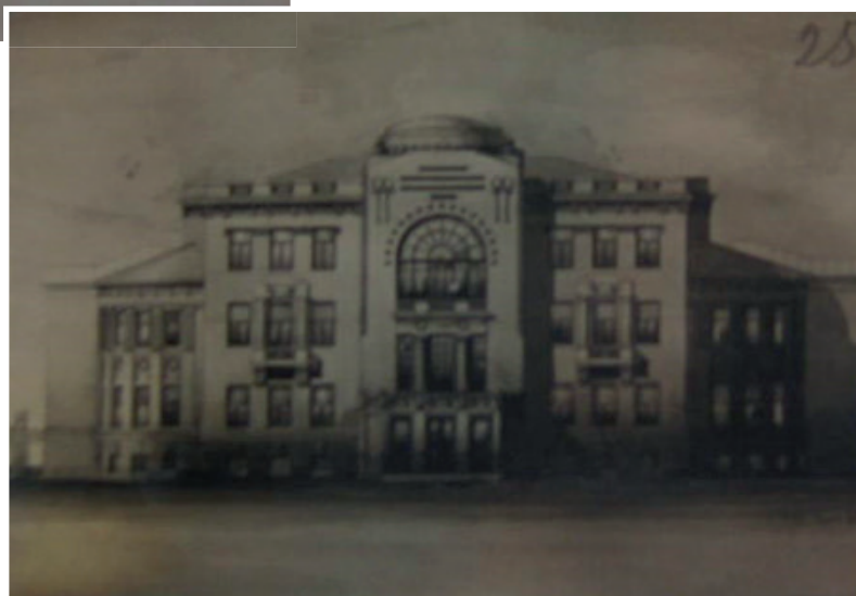
Сурет 3. Орынбор өлке музейі ғимаратының эскиздерінің бірі. XX ғ. басы. ООБМА қорынан.