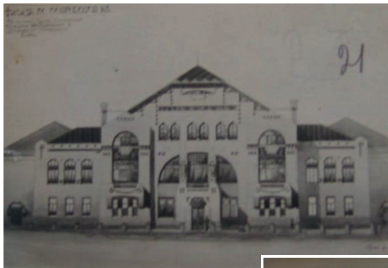
Сурет 2. Орынбор өлке музейі ғимаратының эскиздерінің бірі. XX ғ. басы. ООБМА қорынан.