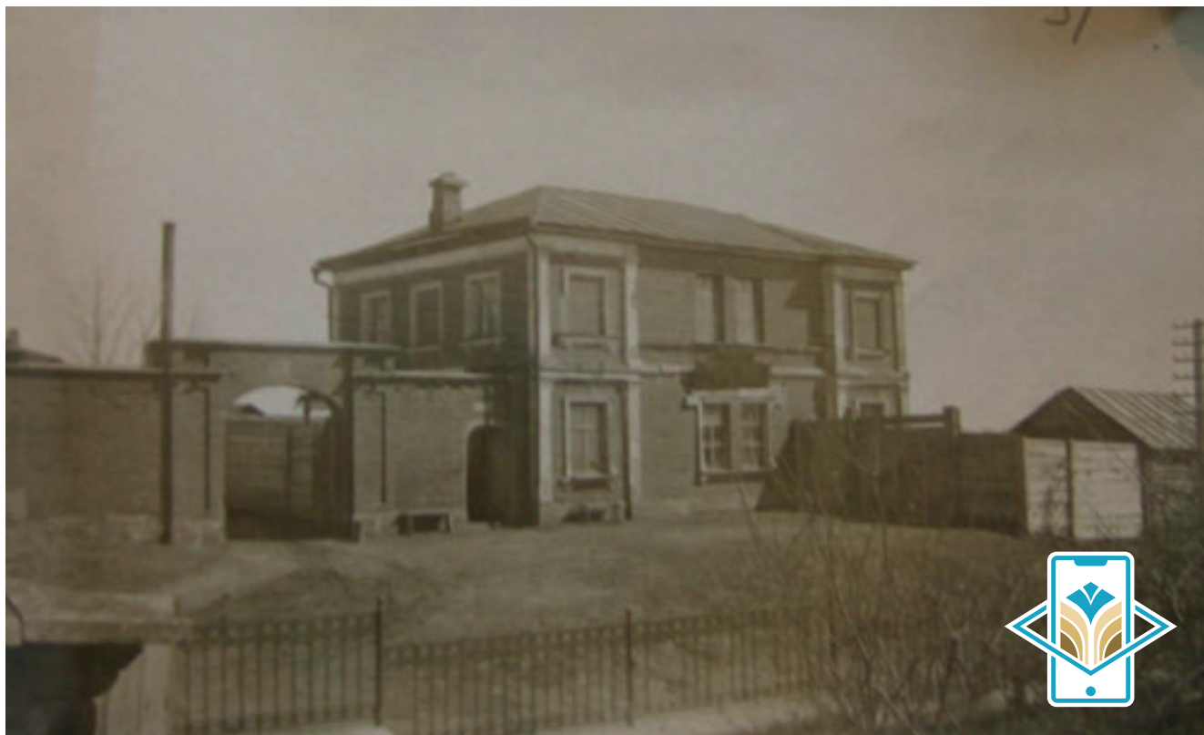
Сурет 1. Музей мен кітапхана орналасқан Орынбор ғылыми архивтік комиссиясының ғимараты. XIX ғ. аяғы.

1887 жылы құрылған Орынбор ғылыми архивтік комиссиясы Орынбордың екі музейінің коллекцияларын жинақтап, біріктіруді қолға алады. 1895 жылдан бастап Орынбор жеке корпусы штабының Геодезиялық бөлімінің фотографиялық павильоны орналасқан шағын екі қабатты тас үйді өз қарамағына алған комиссия «Орынбор өлкесінің музейін құру үшін бұрынғы екі музейдің құндылықтарын жинауға» кірісті (Сурет 1).