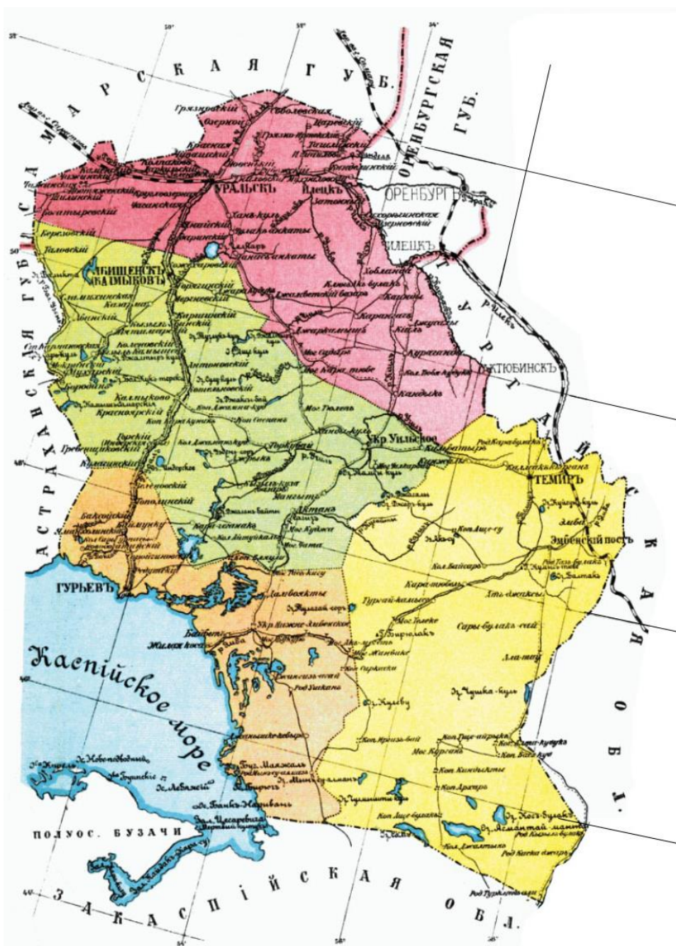
Рис. 5. Территория Уральской области в 1897 г.

Относительно небольшим регионом расселения белорусов (11,5 % от общей численности в Казахстане) являлась территория Западного Казахстана в составе Уральской и Тургайской областей Степного генерал-губернаторства. При рассмотрении первой из них (Рис. 5) следует отметить, что Уральская область была одной из первых исконно казахских территорий, подвергшихся проникновению и заселению беглыми казаками в 20–40-е гг. XVII в. Позднее она стала объектом колонизации Яицкого казачьего войска, которому были предоставлены наиболее плодородные земли, пастбища и богатые рыбными ресурсами участки в рамках «десятиверстной полосы» по правому берегу реки Урал, тогда как левобережье сохранялось за казахским населением. В этой части Казахстана уже в 1620 г. был основан Гурьевский городок, а в 1640 г. укреплен. Дополнительные привилегии войску были дарованы в 1775 г., с момента преобразования Яицкого казачьего войска в Уральское.