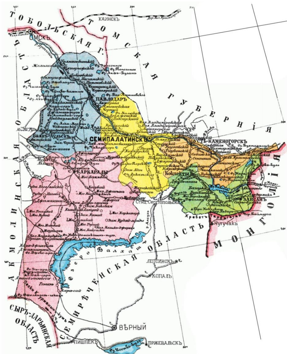
Рис. 2. Территория Семипалатинской области в 1897 г.

Если обратиться к Семипалатинской области, то она занимала особое место в расселении белорусов: здесь была сосредоточена вторая по численности белорусская диаспора не только в рамках рассматриваемого региона, но и в масштабах всего Казахстана. Переселенческое движение в данной области осуществлялось преимущественно за счет казачьего и русско-украинского населения. Начальный этап освоения территории вдоль р. Иртыш, включая основание крепостей и поселений, относится к 1720-м годам [Аполлова, 1976: 122–162; Крих, 2006, 2012]. Существенное влияние на дальнейший миграционный процесс оказала столыпинская аграрная реформа.