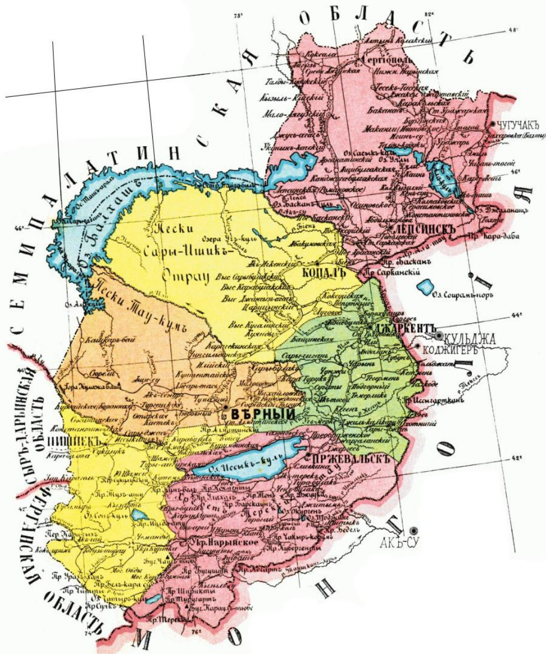
Рис. 4. Территория Семиреченской области в 1897 г.

Крайне незначительным был удельный вес белорусов в соседней Семиреченской области. Из шести уездов, входивших в ее административное подчинение, четыре (Верненский, Жаркентский, Капальский, Лепсинский) изначально были заселены преимущественно казахами, а два остальных – Пишпекский и Пржевальский – кыргызами (Рис. 4).