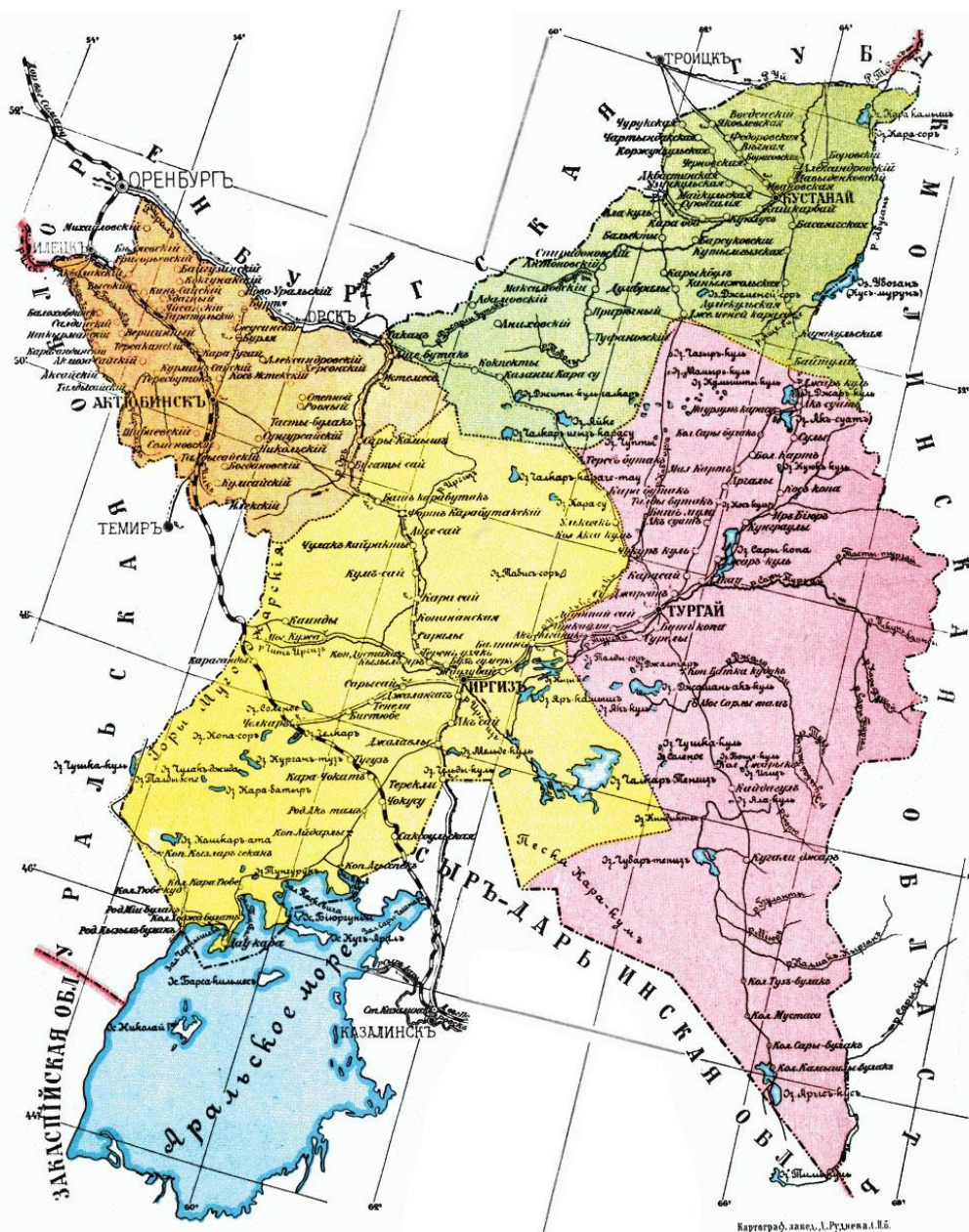
Рис. 6. Территория Тургайской области в 1897 г.

Что касается Мангышлакского уезда Закаспийской области, то его жаркий и засушливый климат, полностью непригодный для ведения традиционного земледелия, обуславливал отсутствие белорусского и украинского населения, что фиксирует перепись 1897 г. В то же время в других пяти уездах области (Ашхабадском, Красноводском, Мервском, Тедженском) проживало 180 белорусов, более половины из которых относились к городскому населению уездных центров [ПВПНРИ, вып. LXXXII, 1904: 54–55].