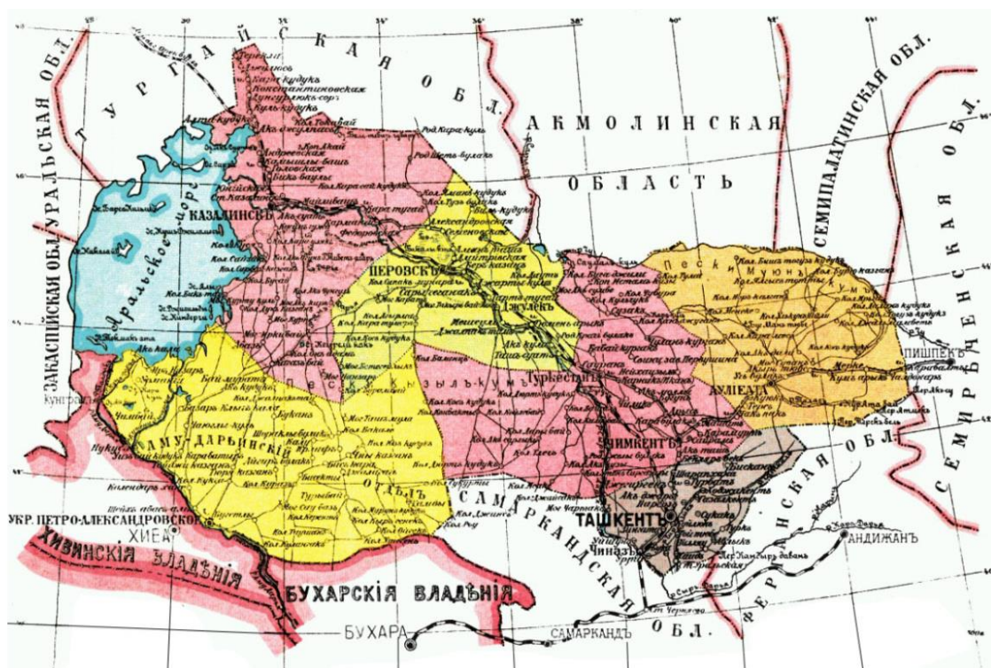
Рис. 3. Территория Сырдарьинской области в 1897 г.

Такое распределение объясняется благоприятными условиями для ведения сельского хозяйства: наличие плодородных земель, а также водных ресурсов - рек Талас, Чу, Аспара и озер Акколь, Биликоль, Кашкентениз. В отличие от других уездов, в Аулиеатинском белорусское население было расселено равномерно как в сельской, так и в городской местности. Привлекательным центром миграции выступал уездный центр – город Аулие-Ата, где проживало 52,6 % всех белорусов области.