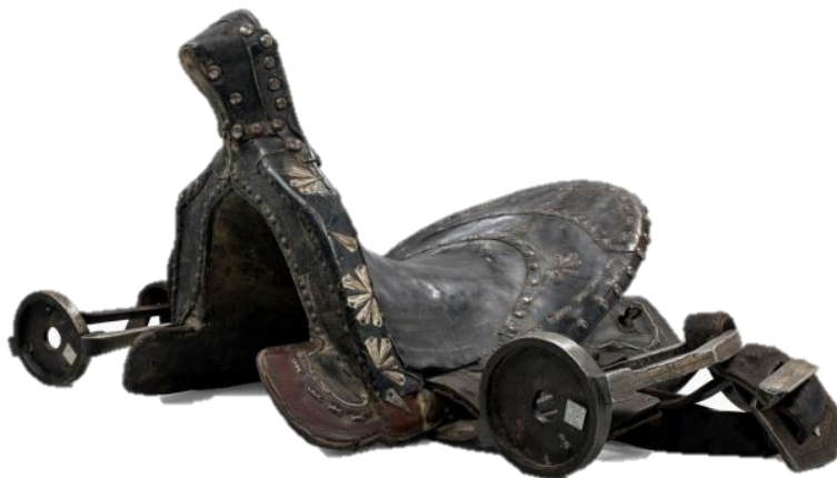
Сурет 2. НҚТ-16338. Қозы күйрық ер.

Ғұн дәуіріне тән ер-тұрманның қаңқалық құрылымы, әсіресе алдыңғы және артқы қастарының дөңгелене қалыптасуы, қазіргі заманғы ер-тұрман үлгілерімен өзара сабақтастықта екендігін көрсетеді және бұл ер шабу дәстүрінің көне ғасырлардан бастау алатынын дәлелдейді.