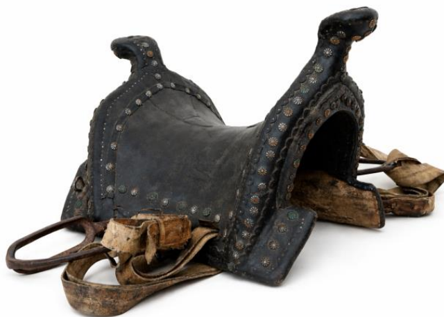
Сурет 5. НҚТ-17013/1. Үйрекбас ер.

Берілген ашамай ер үлгісі – қазақ халқының дәстүрлі ат-әбзелдері мәдениетінің құнды мұрасы. Ол баланы атқа мінуге үйретумен қатар, ұрпақ сабақтастығын, тәрбиелік идеалдарды және символдық дүниетанымды бойына сіңірген. Ғылыми тұрғыдан алғанда, ашамай ерді зерттеу көшпелі қоғамдағы бала тәрбиесі, қолөнер технологиясы және көркемдік таным мәселелерін кешенді түрде қарастыруға мүмкіндік береді.