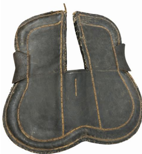
Сурет 7. ГКП-12113. Қалың былғарымен қапталған киіз тоқым.

Қозықұйрық, үйрекбас және айбас ер-тұрмандар – қазақтың дәстүрлі ат-әбзелдеріндегі пішіндік-атаулық ерекшелігімен дараланатын түрлер. Қозықұйрық ер атауы қастың артқы бөлігінің қозының құйрығындай жұмырланып, төмен қарай созыла жасалуына байланысты қалыптасқан; ол көбіне Батыс және Орталық Қазақстанда таралған, салмақты, орнықты отырысымен ерекшеленеді. Үйрекбас ер алдыңғы қасының үйректің басына ұқсас алға созылық, имектеу келуімен аталған, Жетісу мен Шығыс Қазақстан өңірлерінде жиі қолданылған, жеңілдеу әрі жүріске икемді. Айбас ер қасының ай тәрізді дөңгелене иілуінен шыққан атауға ие, Оңтүстік, Шығыс және Орталық Қазақстан аймақтарда көбірек таралған, салт мінуге қолайлы, сәндік-әшекейлік элементтері басым. Аталған ер-тұрмандардың айырмашылығы негізінен қас пішіні, салмақ үйлесімі мен өңірлік қолданысында көрініс табады, ал атаулары халықтық бейнелі ойлау мен тұрмыстық тәжірибеге сүйенген.