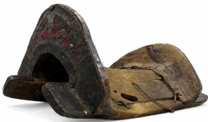
Сурет 4. НҚТ-17898/1. Монголиядан келген екі қасы да биік ер.

Аталған бұйымды Монғолияның Баян-Өлгей аймағынан Қазақстанға қоныс аударған Еркеназ Жайсан атты азаматша өз көршісі А.Т. Байтақова арқылы музей қорына тапсыруға берген.