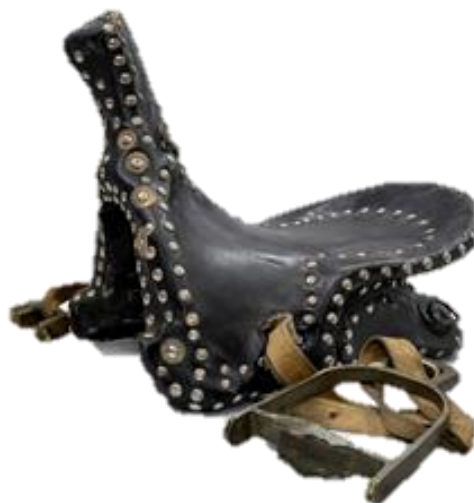
Сурет 3. НҚТ-17157/1. Қозы құйрық ер.

Ақтөбе облыстық тарихи-өлкетану музейінің қорына (НҚТ-17157/1) тіркелген қозықұйрық ер де (сурет 3) – өңірлік және республикалық көрмелерде көпшілік назарын аударған құнды музейлік жәдігерлердің бірі. Аталған ердің ерекшелігі – оның жасанды былғарымен қапталуы, бұл ХХ ғасырдың екінші жартысындағы тұрмыстық және өндірістік материалдарды қолдану үрдісін айқындайды. Ер-тоқымның құрылымы мен сыртқы әрлеуі дәстүрлі қазақ ерлерінің пішінін сақтай отырып, заманауи материалдардың енгізілуін көрсетеді. Осы тұрғыдан алғанда, жәдігер ұлттық ат-әбзелдерінің кезеңдік өзгерістерін зерделеуде маңызды дереккөз болып табылады.