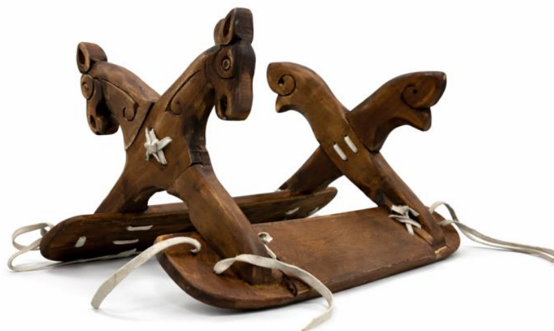
Сурет 5. НҚТ-18142/1.

Осы дәстүрлі үлгілерді негізге ала отырып, қазіргі шеберлердің жасаған ерлері тарихи сабақтастықты сақтаумен ерекшеленеді. Бүгінгі ер-тұрмандарда бұрынғы пішін мен негізгі құрылым сақталғанымен, заманауи құралдар мен жаңа технологиялар қолданылып, беріктігі мен ыңғайлылығы арттырылған. Сонымен қатар, сәндік элементтерінде дәстүрлі ою-өрнек ықшамдалып, қазіргі талғамға бейімделген. Бұл үрдіс ұлттық мұраны жаңғырту мен оны қазіргі мәдени кеңістікке енгізудің тиімді жолы ретінде бағаланады.