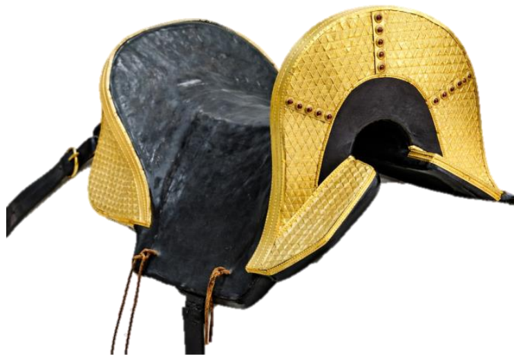
Сурет 1. НҚТ-18085. Ғұн дәуірінің алтын, күміс қосындылары шытырымен (фольга) қапталған ері.

Бұл олжа ғұн дәуіріндегі жерлеу дәстүрлері мен әскери ат-әбзелдерінің әлеуметтік маңызын айқындап қана қоймай, өңір аумағында ғұн тайпаларының болғандығын нақты археологиялық деректермен дәлелдеуге мүмкіндік берді.