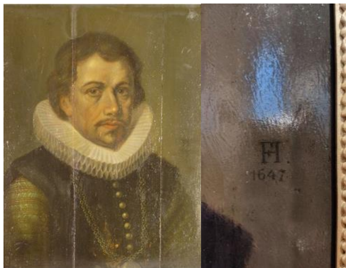
Рис.1. Франс Хальс (1582/1583–1666). Портрет мужчины. 1647. Дерево, масло. 50,5 × 37 см.

Коллекция Азербайджанского национального музея искусств