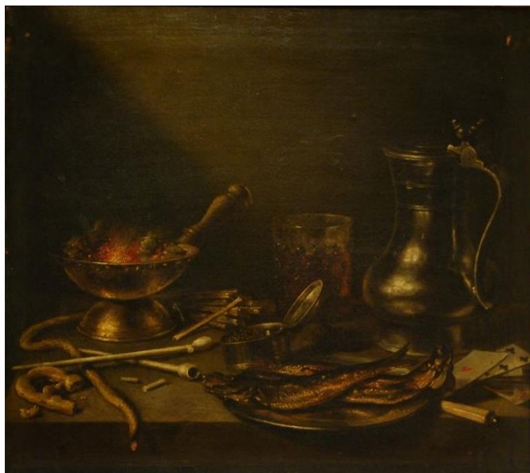
Рис. 2. Питер Клас (1597–1661).

В первой половине XVII века в Голландии сформировалось особое направление натюрморта, получившее название “vanitas” («суета сует») или “momento mori” («помни о смерти»). Идейное содержание подобных натюрмортов объединяет средневековые представления о бренности земной жизни и нравоучительные принципы протестантизма. Традиционные атрибуты «vanitas» — череп, часы, догорающая свеча и наполовину сгоревшие книги — в символической форме передают зрителю мысль о тщетности земных желаний и человеческих страстей [Тарасов, 2004: 66].