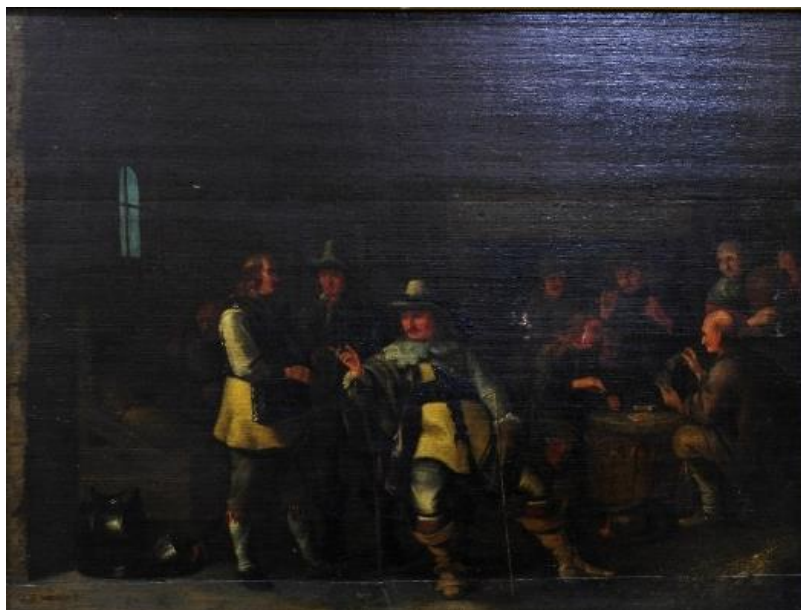
Рис. 4. Абрахам ван Вестервельд (1620/1621–1692). Сцена в кордегардии. Дерево, масло. 40 × 51 см.

Коллекция Азербайджанского национального музея искусств