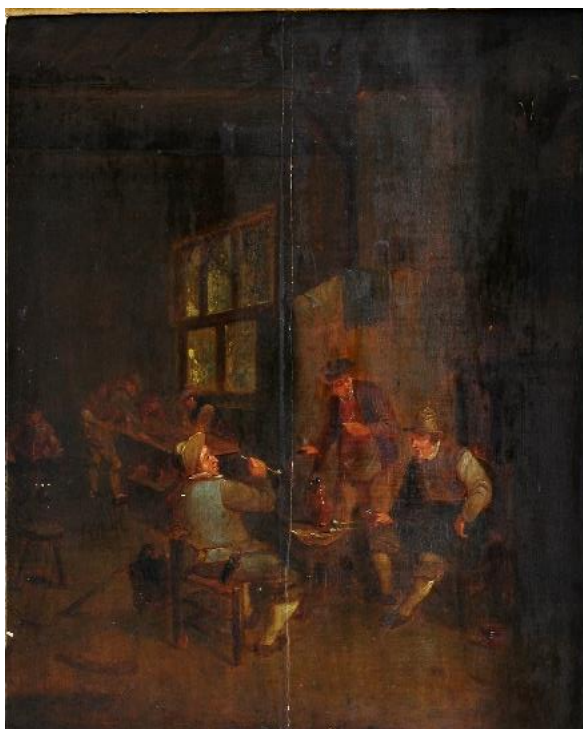
Рис. 3. Адриан ван Остаде (1610-1685). Курильщики в таверне. 1669. Дерево, масло. 44x36 см.