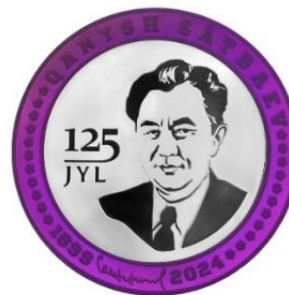
Рис.4. Монета из серебра с танталом QANYSH SÁTBAEV. 125 JYL