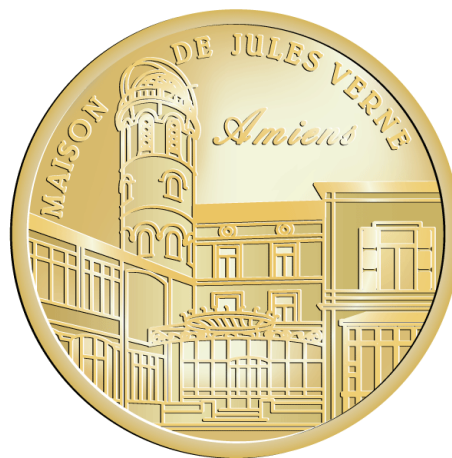
Рис. 7. Токен дома-музея Жюль Верна (Франция)

Потенциал развития музейных токенов в Казахстане. В настоящее время Казахстан обладает значительным потенциалом для развития музейных токенов как элемента культурной индустрии и музейной коммуникации. Развитие внутреннего туризма, рост интереса к национальной истории и культуре, а также наличие современной производственной базы создают благоприятные условия для формирования нового направления сувенирной и коллекционной продукции.