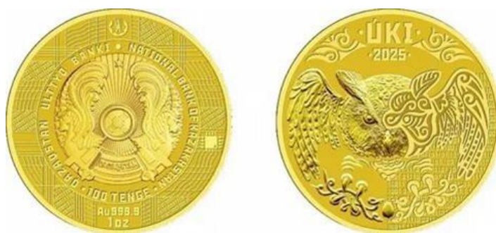
Рис. 5. Инвестиционные монеты

Музейный токен как форма культурной и музейной коммуникации. Музейный токен представляет собой сувенирное металлическое монетовидное изделие или жетон, изготовленный с применением технологий монетного производства и не являющийся средством денежного обращения. В современной музейной практике токены используются как памятные, коллекционные и культурно-информационные объекты, посвященные музеям, историческим событиям, архитектурным памятникам и национальному наследию.