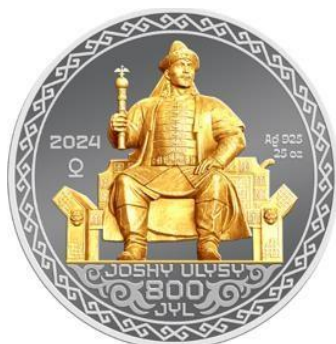
Рис.1. Монета из серебра JOSHY ULYSY. 800 JYL

На рисунке 1-4 представлены примеры памятных и инвестиционных (Рис.5-6) монет Национального Банка Республики Казахстан, отражающих развитие отечественной нумизматической школы.