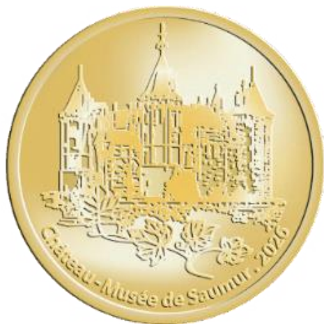
Рис. 6. Токен замка-музея Сомюр (Франция)

На рисунке 6-7 представлены примеры современных музейных и туристических токенов Европы.