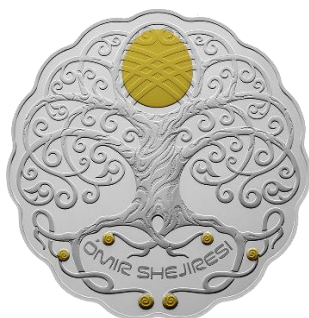
Рис.3. Монета из серебра с золочением ÓMIR SHEJIRESI