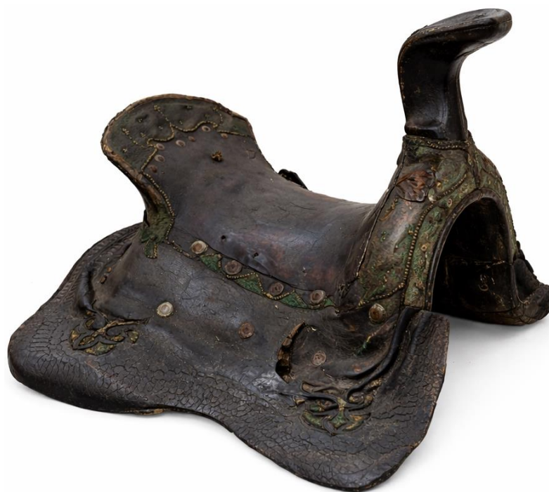
Сурет 1. НҚТ-412. Үйрек бас ер-тоқым (АОТӨМ қорынан).

Соның бірі 1-ші суретте көрсетілген ер-тоқым. Ол музей қорына тіркеліп, этнография залына экспозицияланған типологиялық жағынан үйрек бас деп аталатын ер-тоқым өзінің ерекше көркемдік шешімімен және шебердің шеберлік деңгейі арқылы келушілердің назарын аударып келеді [НҚТ 1-1295. 83].