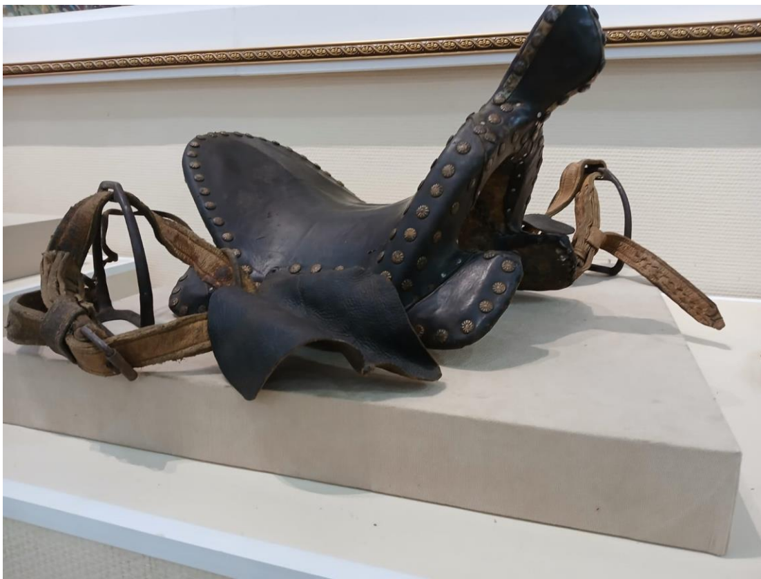
Сурет 5. НҚТ-17266. Қозықұйрық ер-тоқым (АОТӨМ қорынан).

ердің көркемдік-эстетикалық сипатын айқындап, оның дәстүрлі қолөнер бұйымы ретіндегі ерекшелігін көрсетеді. Ердің үзеңгі бау тағылатын жоғарғы бөлігінде қанатша, қорғағыш былғары немесе үзеңгі бауының жапқышы шегемен бекітілгенін көруге болады.