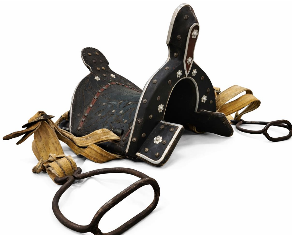
Сурет 3. НҚТ-12112. Шошақбас ер-тоқым (АОТӨМ қорынан).

Музейдің ат әбзелдер коллекциясы қазақтың шошақ бас ерімен де (НҚТ-12112) толықты. Қатты қаңқалы, алдыңғы, артқы қастардан, отырғыш бөлігі белағаштан және екі қапталдан тұрады. Алдыңғы және артқы қасы биік, бұл оның қауіпсіздік және ұзақ сапарға арналғанын көрсетеді (Сурет 3).