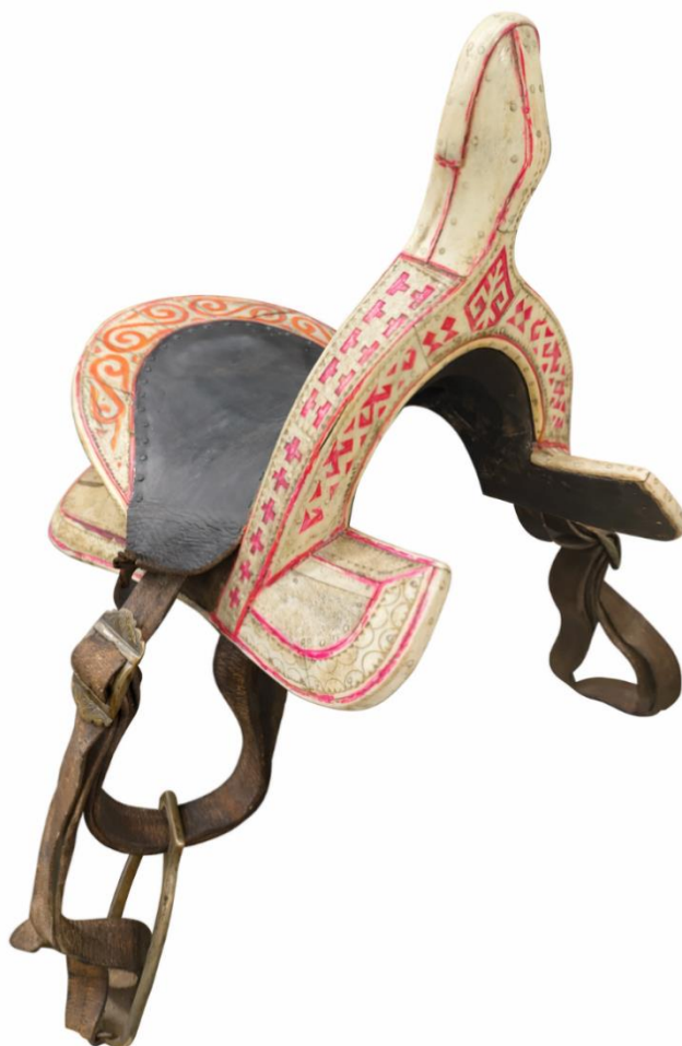
Сурет 4. НҚТ-10084. Бала ер-тоқым. (АОТӨМ қорынан).

1984 жылы шебер Қарамұқан Басшин жасаған, бұғының мүйізі сүйегімен сүйектелген бала ері (НҚТ-10084) музей қорына қабылданып, этнография залының экспозициясына орналастырылды. Музей деректеріне сәйкес, аталған ерді шебер 1972 жылы қыз балаға арнап жасаған. Ерді сүйектеуі үшін шебер Сібірден бұғының мүйіз сүйегін алдырған. Бұл ер түрі балалар кәмелет жасына жетіп, аяқтары үзеңгіге тиген кезеңнен бастап (қыз балаларды қоса алғанда) пайдаланылған (Сурет 4). Ер-тоқым қастардан, белағаштан және қапталдардан тұрады [НҚТ-9621-12131. 68].