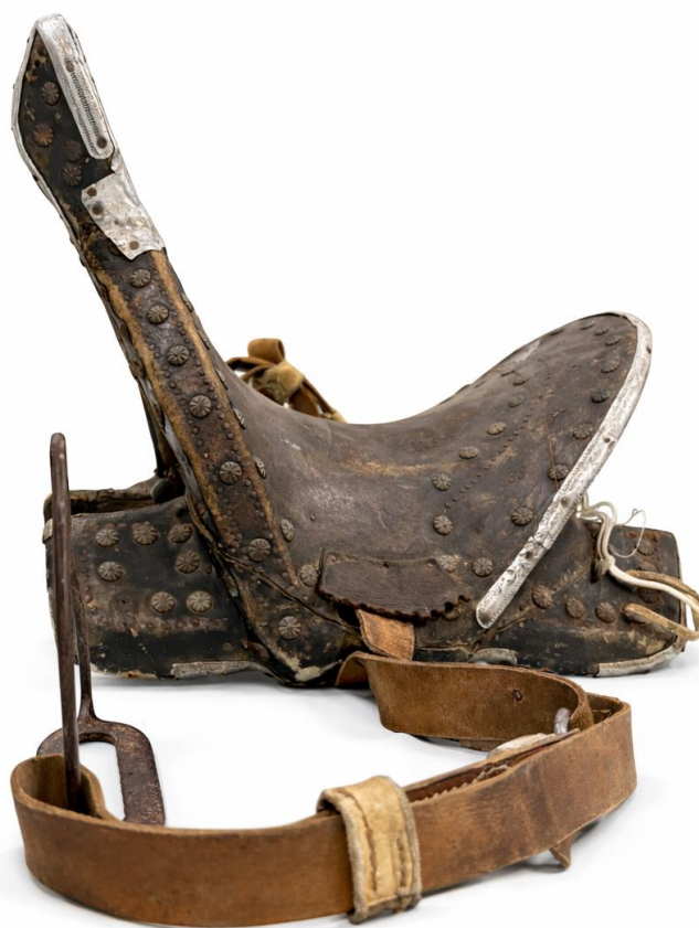
Сурет 2. ГКП-11839. Қозықұйрық ер-тоқым (АОТӨМ қорынан).

Музей қоры 1990 жылы Ақтөбе қаласының тұрғыны Жанпейісова тапсырған қозықұйрық ерімен де толықтырылып, негізгі қор тізімдерінің қатарына енгізілген болатын [НҚТ 9621-12131. 319].