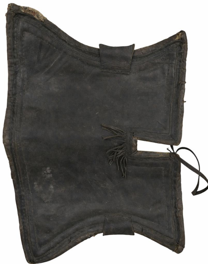
Сурет 6. КП-12113. Былғарымен қапталған ер-тоқым (АОТӨМ қорынан).

Төменде көрсетілген былғарымен қапталған тоқым музей қорына (НҚТ-17013) тіркеліп, экспозицияда келушілерге таныстырылып келеді (Сурет 6). Құрылымы екі қабатты: ішкі жағы тығыз, жұмсақ қой жүнінен жасалған, бұл оның амортизациялық қасиетін арттырады; ал сыртқы беті қара түсті былғарымен қапталған. Шеттері берік жиектеліп, тозуға төзімді етіп өңделген.