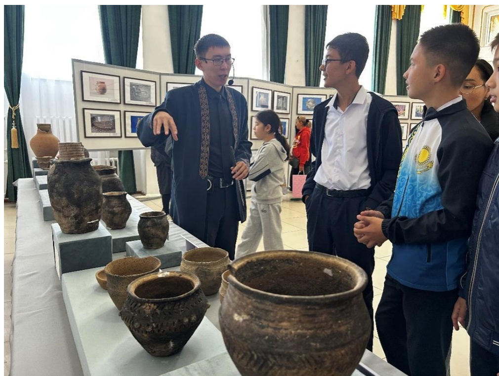
Сурет 2. Экскурсия барысы. Ырғыз ауданы.

«Қазақ даласындағы қыш-құмыра жасау кәсібі» тақырыбында өткізілген экскурсияның өзі, шеберлік сағатты ескермеген кезде, дәріс форматында өткізілді. Алайда дәріске қарағанда экскурсияның негізгі ерекшелігі, оның екі негізгі құрамдас бөлігі болуы – көрсету және баяндау (әңгімелеу). Бұл екеуі өзара тығыз байланысты және бір-бірін толықтырып отырады. Көрсету мен баяндаудың ара-қатынасы экскурсия тақырыбына, объектілердің сипатына, экскурсия жетекшілерінің шеберлігіне және басқа да факторларға байланысты өзгереді [Александров, 2021: 87]. Жылжымалы көрменің экскурсия мазмұны қыш (керамика) ұғымынан бастап, оның тарихын және Ақтөбе облысында табылған қыш-құмыралардың ерекшеліктерін, тарихи даму кезеңдерін көрсетумен шектелген жоқ, экскурсия өз жалғасын шеберлік сағаттан тапты деп айтсақ болады.