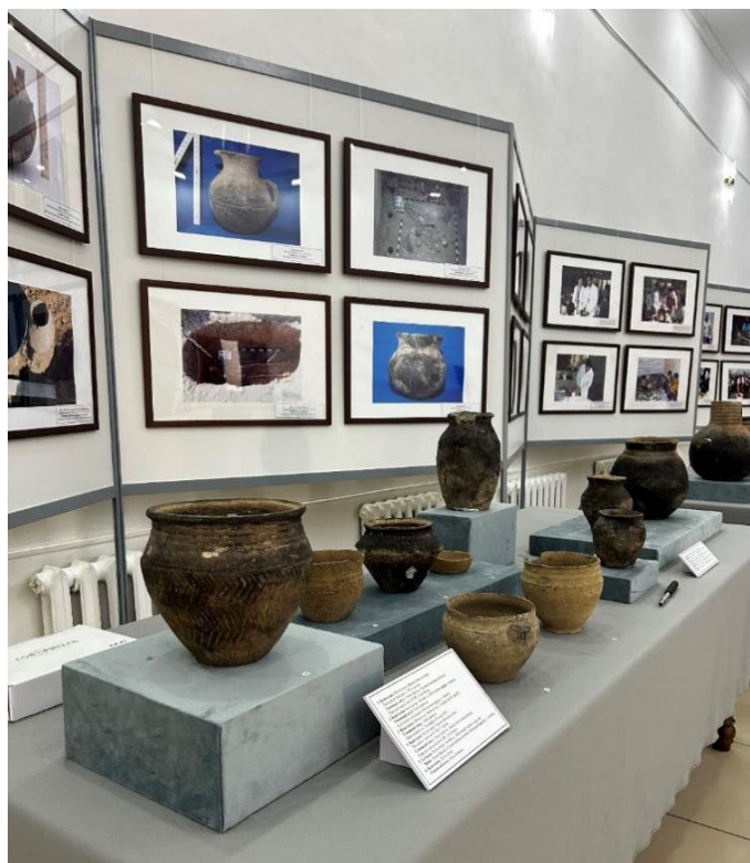
Сурет 1. Көрменің орналасуы. Ойыл ауданы.

Көрме құрылымын екі бөлімге бөліп қарастырсақ болады. Бірінші – негізгі бөлімді ХХ ғасырдың екінші жартысынан бастап, бүгінгі күнге дейін Ақтөбе облысында жүргізілген археологиялық қазба жұмыстары мен кездейсоқ табылған қыш-құмыралар коллекциясы құрады. Көрмедегі құмыралар 4 тарихи кезеңге сәйкес, хронологиялық ретпен орналастырылды. Қола дәуірінде Ақтөбе жерінде алғашқы бақташылар мен жартылай отырықшылықпен айналысқан жергілікті тұрғындар қорғандар сала бастаған. Олардың жерлеу орындарынан Андронов мәдениетіне жататын 6 қыш ыдыс табылған, олар 1-ші суретте көрсетілген. Сонымен қатар, көрмеде ерте темір дәуірі, савромат-сармат кезеңіндегі алғашқы көшпелілер мәдениетін көрсететін 4 қыш-құмыра орналыстырылды. Соның ішінде 2019 жылы Темір ауданынан табылған, «Тасқопа көсемі» атауымен белгілі, маңызды археологиялық жәдігерлер саналатын құмыралар да көрсетілді. Ғұн-сармат кезеңінде, б.з. II-IV ғасырларындағы Ақтөбе жерінде өмір сүрген тайпалар туралы ақпаратты көрмедегі 7 қыш ыдыс пен ғұрыптық ыдыстар береді. Негізгі бөлімінің соңғы кезеңі ерте орта ғасырды қамтыды. Бұл кезеңге қатысы бар жәдігерлер ретінде музей қорында сақтаулы 3 қыш ыдыс көрсетілді. Қыш өнерінің өңірде өте жоғары деңгейге жеткендігін көрсету мақсатында кездейсоқ табылған жәдігерлердің қатарына жататын шығыр құмырасы қойылды.