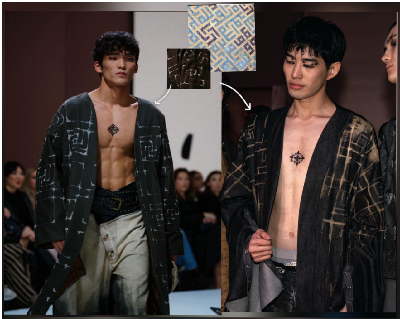
Рис. 4. Изделия с орнаментами фасада Мавзолея Ходжи Ахмета Ясави.

К следующей группе маркеров — ключевых элементов коллекции — относится изделие в виде жилет-безрукавка с фактурой черепов, которая отражает тему утраченных культурных слоев и археологической памяти региона. Черепная текстура не трактуется как символ смерти, а служит визуальной метафорой исчезнувших цивилизаций, сохранившихся в культурной памяти территории Туркестана (рис. 5). Это изделие выступает средством репрезентации исторических пластов, где материал становится носителем следов времени и накопленной истории.