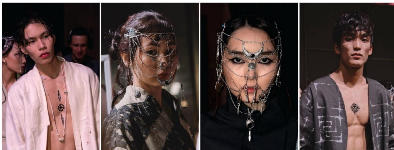
Рис. 3. Переосмысление традиционных элементов: трансформация орнаментов, аксессуаров и тату-мотивов в актуальный дизайнерский язык.

Внутренняя структура коллекции формируется за счёт ряда ключевых изделий, в которых наиболее полно проявляется концепция исторической памяти Древнего Туркестана, которые демонстрируют не только художественные решения, но и функционируют как семиотические маркеры, связывающие современную моду с культурными и духовными кодами региона.