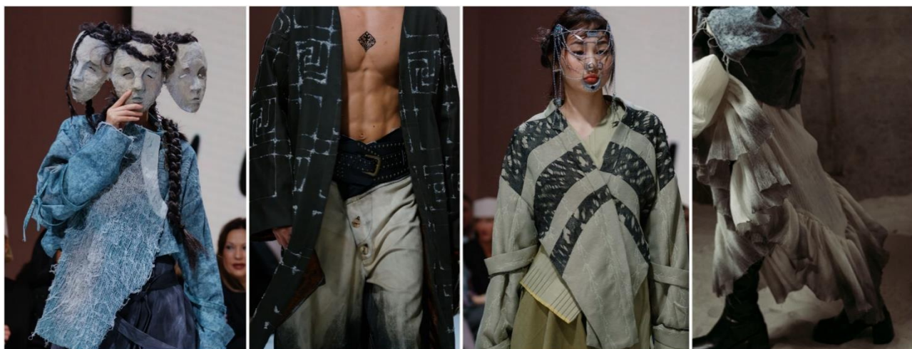
Рис. 2. Текстильные эффекты, имитирующие воздействие времени: выцветание, эрозия поверхности, следы истории.

Эти приёмы трактуются как метафорическая реконструкция археологического процесса – выявления, сохранения и репрезентации культурных следов. Состаривание в данном случае не является декоративной стилизацией: оно воспроизводит логику времени как разрушительной и одновременно сохраняющей силы. Песок интерпретируется как медиатор между прошлым и настоящим, поскольку именно через песочные слои археологи обнаруживают материальные свидетельства истории. Реставрационные швы, в свою очередь, отражают стремление к восстановлению непрерывности культурной традиции, даже если эта традиция представлена фрагментарно. То есть техники обработки ткани превращаются в самостоятельные семиотические единицы, которые формируют «материальную археологию» коллекции.