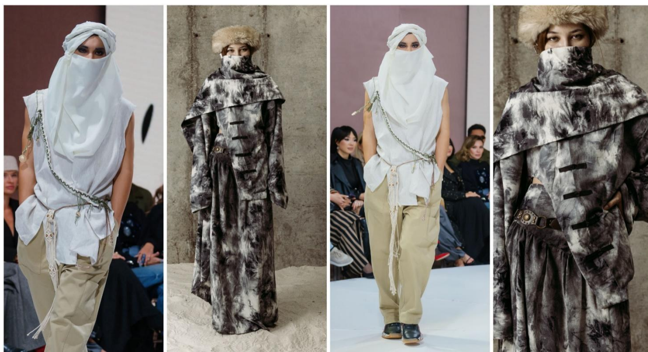
Рис. 7. Изделия с образами караванных торговцев, символизирующие культурный обмен на Шёлковом пути.

Длинная рубашка и многослойная конструкция одежды символизируют не только практическую адаптацию караванщиков к суровым условиям пустынь и степей – защите от палящего солнца, пыли и песчаных бурь, – но и их культурную устойчивость. Силуэт одежды отсылает к историческим формам традиционной тюркской одежды, подчёркивая преемственность культурных кодов и гармонию человека с окружающей средой. Эти элементы создают визуальный язык, через который современный зритель может ощутить ритм жизни караванов, их связь с природой и культурным наследием региона.