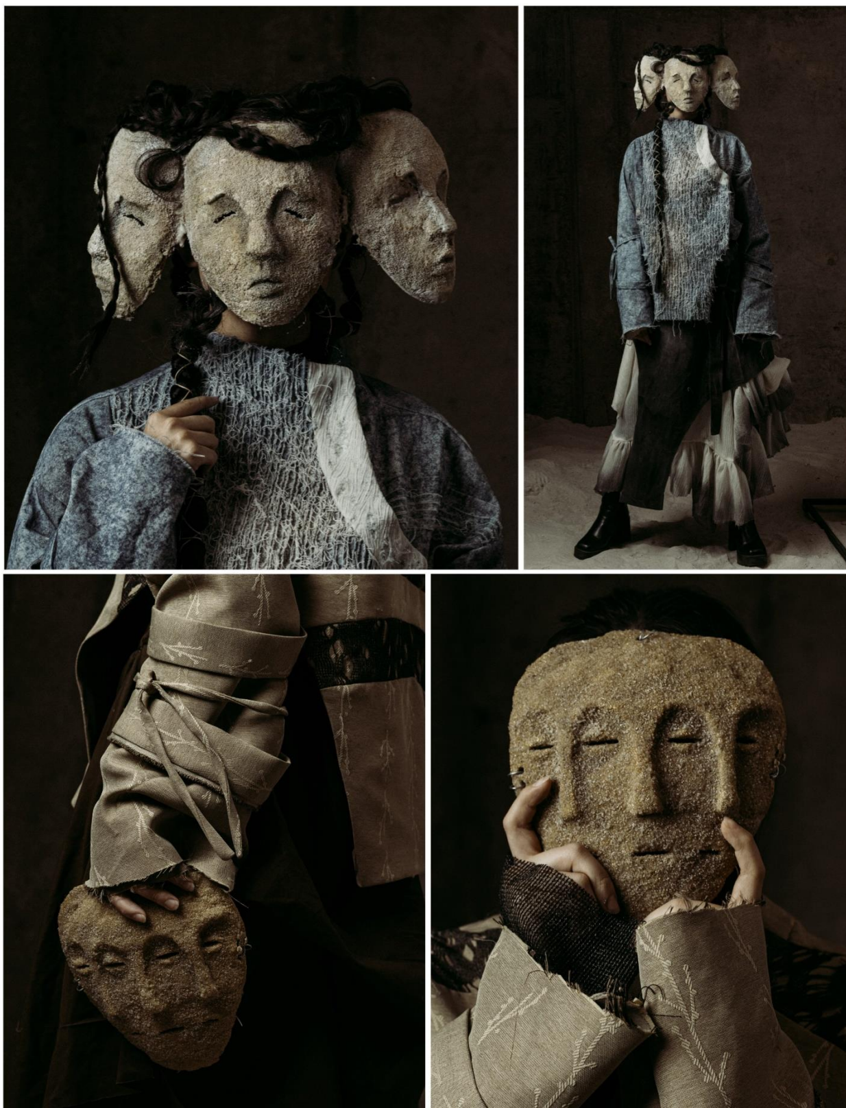
Рис. 6. Маски с трёхмерной формой, использованные как декоративные элементы коллекции.

Туркестан издавна считался жемчужиной Великого шёлкового пути, связывавшей Восток и Запад не только торговыми потоками, но и духовными смыслами [Turkestan, 2017]. Шёлковый путь выполнял не только экономическую, но и духовную, а также цивилизационную функцию, объединяя народы и поколения через обмен опытом, традициями и материальными артефактами [Omarbekov, Otarbayeva, 2025: 152].