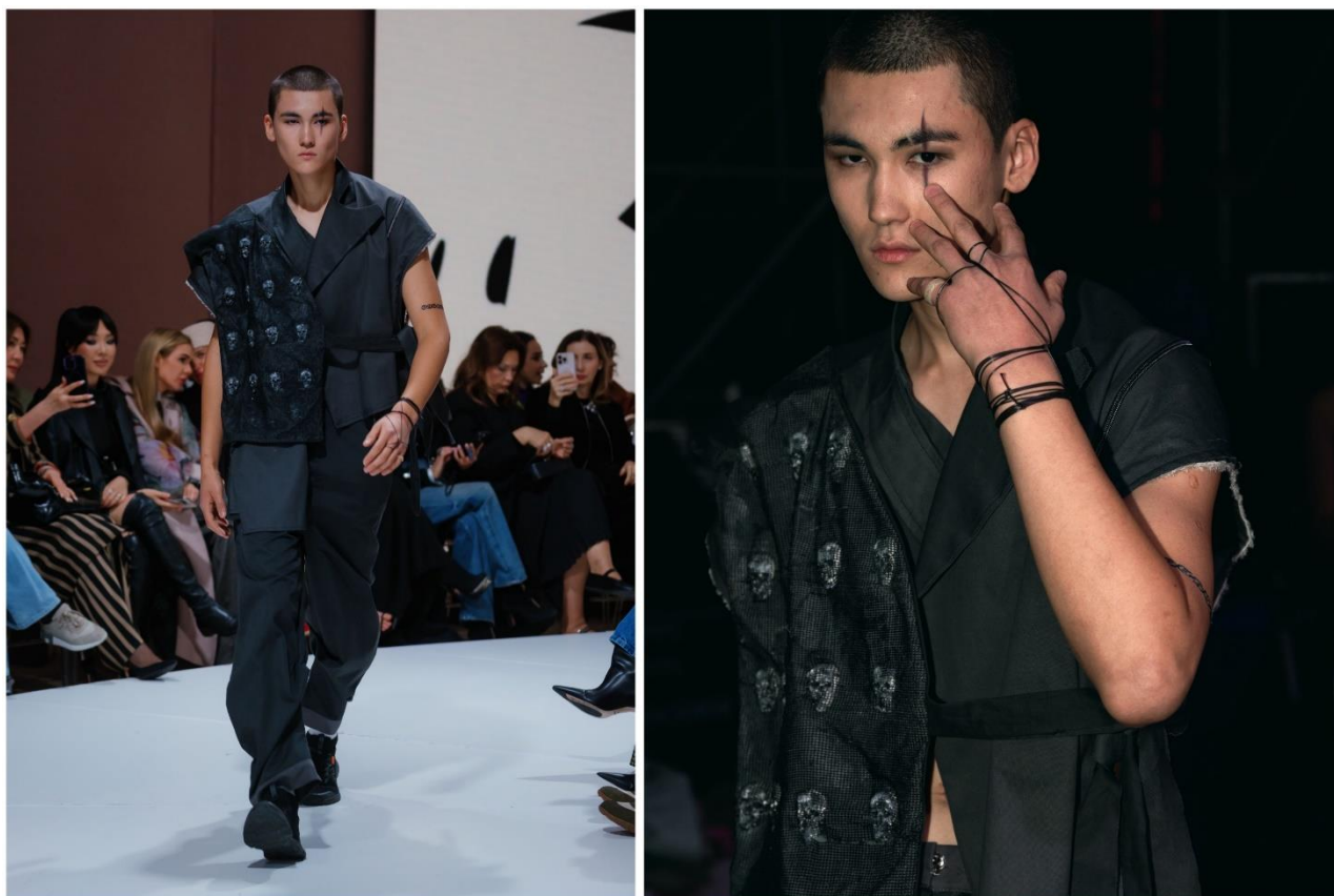
Рис. 5. Жилет-безрукавка с текстурой черепов, символизирующей утраченные культурные пласты региона.

Важное место в семиотической структуре коллекции занимает маска с тремя лицами, интерпретирующая многомерность человеческой идентичности (рис. 6).