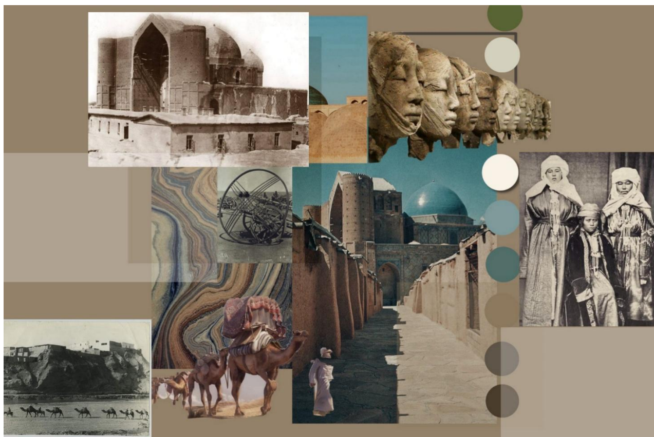
Рис. 1. Коллаж визуальных референсов, отражающих культурно-эстетическое наследие Древнего Туркестана.

Коллекция представляет собой попытку концептуального переосмысления культурного кода Древнего Туркестана через призму современного дизайна костюма. В её основе лежит исследовательский подход, направленный на выявление и визуальную интерпретацию исторической памяти региона. Проект рассматривает Туркестан как многослойный культурный феномен, в котором архитектурное наследие, традиционные формы одежды, материальные артефакты и символические структуры образуют совокупность знаковых систем. Именно эти системы становятся предметом художественного анализа, трансформируясь в новый пласт современной модной семиотики.