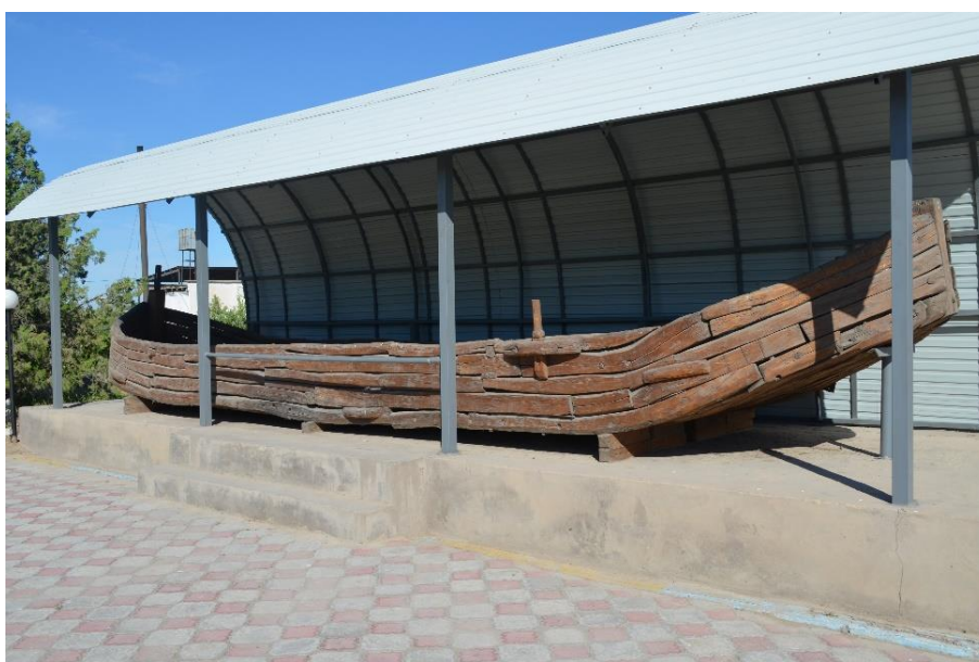
Сурет 2. «Отырар» мемлекеттік археологиялық музей-қорығының ауласындағы томар қайық

Музейдегі томар қайықты Өзбекәлі Жәнібековтің тапсырмасымен 1992 жылы Отырар өңірінің ағаш шебері Сыздықов Надайымбек ұста шапты [Жұмашев, 2017: 37]. Қайықтың жарығын таза мата қиындысымен тығындап, сыртын ешкінің майымен майлаған. Қайық Отырар ауданы, Шеңгелді ауылының тораңғыл тоғайында дайындалып, құрастырылды. Қайықтың жасалу сәтін сол кездегі Отырар музей-қорығының бөлім меңгерушісі Абдулла Жұмашев суретке түсіріп алып, біздің заманға жеткізген (Сурет 2).