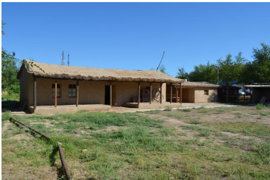
Сурет 1. «Отырар» мемлекеттік археологиялық музей-қорығының ауласындағы Қоржын үйі

Сонымен қатар, көпшілік көрерменді Отырар музей-қорығының ауласындағы қайық ерекше қызықтырады. Ертеректе жергілікті тұрғындар өзен бойындағы ауылдар мен елді мекендерге қайықпен барғаны белгілі. Отырар өңіріндегі Үшқайық, Маяқұм, Шеңгелді, Ақжар өткелдерінде қайық пайдаланылған. Қазақтар қайығын томар қайық деп те атаған. Қазақ ұсталары қайық жасау үшін ара, балта, байтесе, бұрғы, тоқпақ пайдаланған [Жұмашев, 2017: 39].