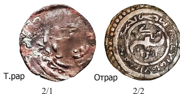
Фото 2/1 и 2/2. Лицевая сторона фалсов Б.рар-а – Т.рар-а? и Отрара.

Во-первых, было замечено, что лицевая сторона (с изображением тамги) композиционно практически повторяет тип фалсов Отрара 670-х – 690-х гг.х. (фото 2), и, возможно, была просто скопирована резчиком с пропущенным первым алифом в названии монетного двора.