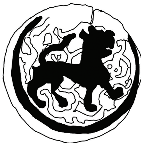
Рис. 1. Реконструкция оборотной стороны медной монеты с зооморфным изображением.

Осенью 2022 г. поиски и изучение находок монет с территории городища Актобе у Бесагаша было продолжено. Была получена новая и неожиданная информация с Таласской долины на территории Кыргызстана, откуда были присланы фотоизображения двух экземпляров фалсов с зооморфным изображением и с частично сохранившимися круговыми легендами. Самым неожиданным и существенным дополнением к атрибуции этих медяков стало наличие, видимо, цифр года чеканки в круговой легенде. К сожалению, сама надпись практически не видна, что порождает сомнения в правильности чтения этих цифр и даже в интерпретации увиденного. Можно подозревать, что и в данном случае резчик имитировал круговую легенду. Даже если в данном случае резчик скопировал круговую легенду с монет Отрара и дописал год цифрами (заметим, что монет Отрара с годом в круговой нам не известно), то в любом случае чеканка изучаемых монет не могла бы начаться ранее этого изображенного года. Прочтенный предположительно год 68(9?) г.х./1290 г. вполне укладывается в хронологический интервал 688-694 гг.х./1289-1295 гг. периода смуты в Хорасане и захвата этого региона ханом Кайду (фото 3/1 и 3/2) [Петров, 2022; Рашид-ад-дин, 1946: 144; Biran, 1997: 57-58; Thackston, pt. 3, 1999: 595a]. Несмотря на то,