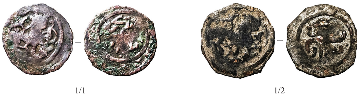
Фото 1/1-2. Вид медных монет с изображением зверя.

Цель настоящей работы – уточнение атрибуции медных фалсов Чагатаидского ханства с зооморфным изображением, а также выяснение средневекового названия населенного пункта, бывшего эмиссионным центром, развалины которого под названием Актобе расположены у села Бесагаш в Жамбыльском районе Казахстана. В 2021 г. на археологическом памятнике Актобе, располагающемся непосредственно у границы с Кыргызстаном, сотрудниками ЦГМ РК в рамках исследований по гранту проводилась проверка сообщений местного населения о находках здесь старинных монет. В результате сведения подтвердились, и при этом, был обнаружен ранее неизвестный массовый выпуск медных монет конца XIII века. Поскольку эти фалсы были первой находкой однозначно местного монетного двора (такие монеты больше нигде нами не обнаружены), то именно с нее и началось исследование нумизматических объектов на территории Актобе. К сожалению, археологических исследований на этом памятнике не проводилось вовсе.