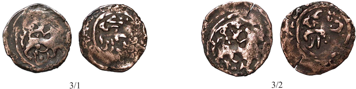
Фото 3/1 и 3/2 Фалсы Б.рар-а / Т.рар-а? с годом 68(9?) г.х.

что наше предположение, сделанное ранее о датировке этих выпусков фалсов [Петров, 2022: 30-35] предварительно подтверждается, следует учитывать еще и сложность прочтения последней цифры года, поскольку она видна не полностью на обеих экземплярах.