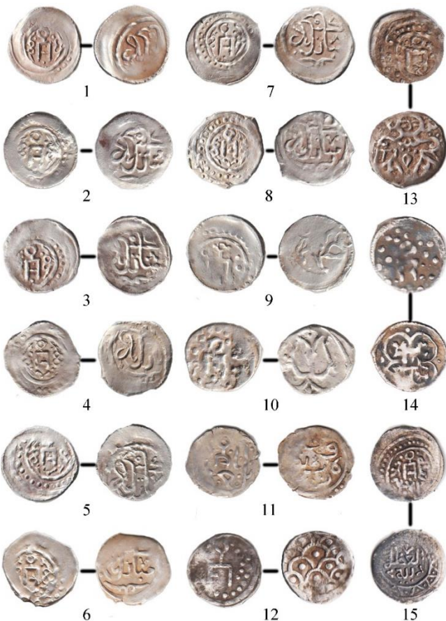
Фототаблица 2. Монеты с «двуногой» тамгой.