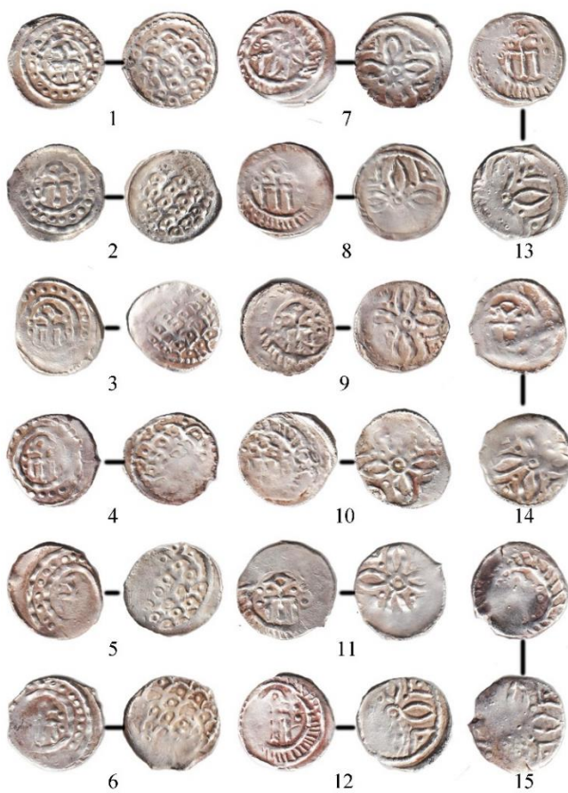
Фототаблица 1. Монеты с «трёхногий» тамгой.