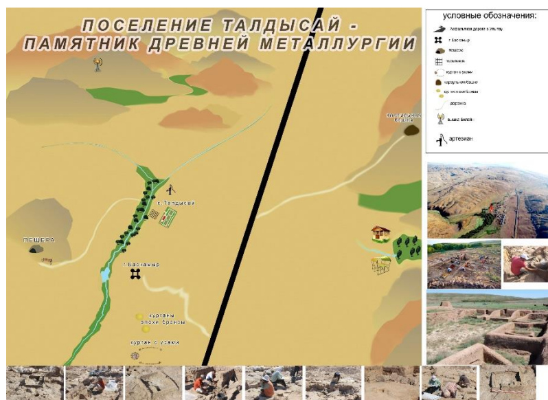
Сурет 1. Талдысай кешені панорамасы

Қорыта келгенде, «Ұлытау» ұлттық тарихи-мәдени және табиғи қорық-музейінің мәліметтеріне сәйкес, жыл сайын Талдысай елді мекені арқылы Ұлытауға 39 мыңнан астам туристер келетінін ескерсек, Талдысай кешені мәдени-тарихи туризм аймақтық дамудың басты турсурсы бола алады, өйткені оның туристерді саяхаттауға шабыттандыратын өте маңызды сипаттамалары жеткілікті. Сондай-ақ Талдысай кешенін келушілер өзі таңдаған тарих кезеңінде өмір сүретіндей жағдай жасалынатын «тарих кезеңінде өмір сүру уақыт машинасы» ретінде пайдалану қажет.