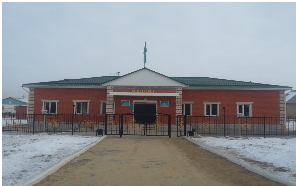
Сурет 1. Қазалы аудандық тарихи-өлкетану музейі

Музей залдары 114,4 кв. шаршы метрді алып жатқан ғимаратта орналасқан.