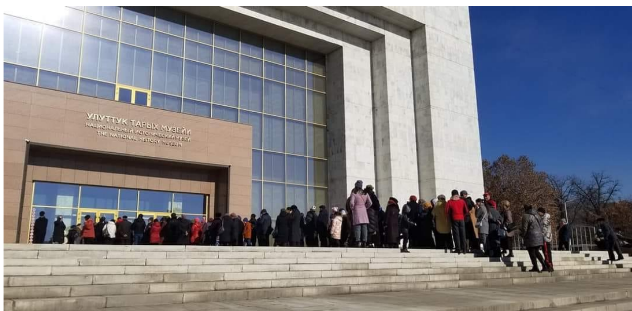
Рис. 3. Большая очередь перед историческим музеем.

Национальная идентичность и локальная культура. Года два как локальное стало приоритетом. О важности локальной культуры, истории мы говорим так часто, как можем. В контексте музеев это еще о разнообразии и возможность уйти от похожих друг на друга музеев. Музейный эксперт, посетивший Кыргызстан в этом году, характеризуя музеи Кыргызстана, отметил, что во многих местных музеях он испытывал ощущение, будто один и тот же музей следовал за ним всюду. Именно поэтому появление на культурной карте так называемых «уникальных» музеев вызывает неподдельное восхищение.