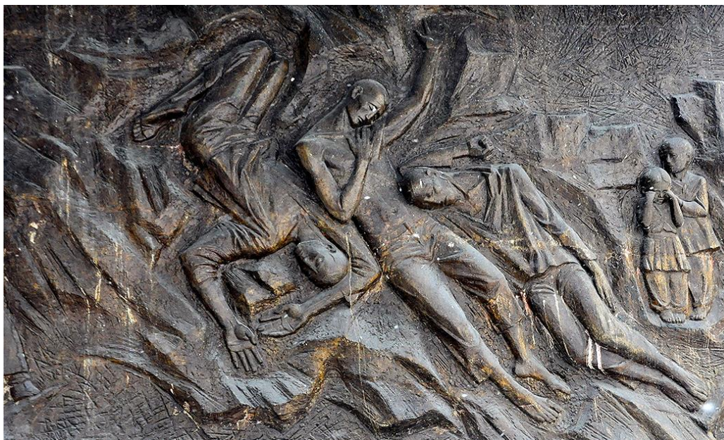
Рис. 1. Барельеф памяти жертв политических репрессий. «Ата-Бейит».