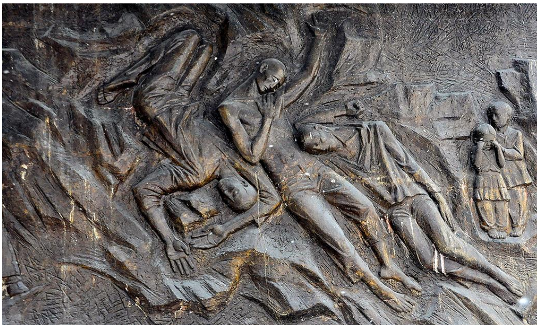
Рис. 1. Барельеф памяти жертв политических репрессий. «Ата-Бейит».